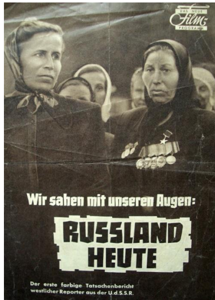
Abbildung 9: Filmprogramm Russland heute.