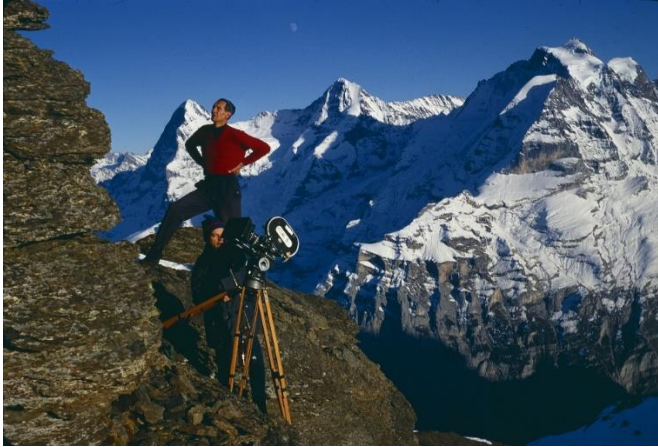
Abbildung 11: Dreharbeiten zu James Bond.