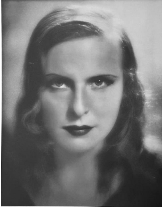
Abbildung 4: Leni Riefenstahl als Junta.