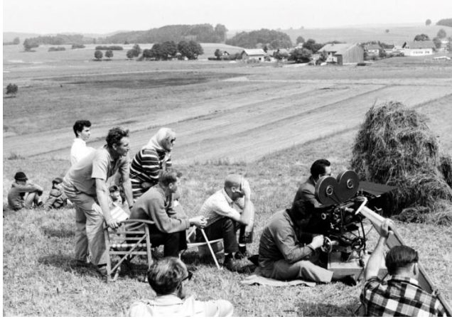
Abbildung 10: Dreharbeiten zu Gesprengte Ketten.